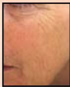
vor der Bhdlg.